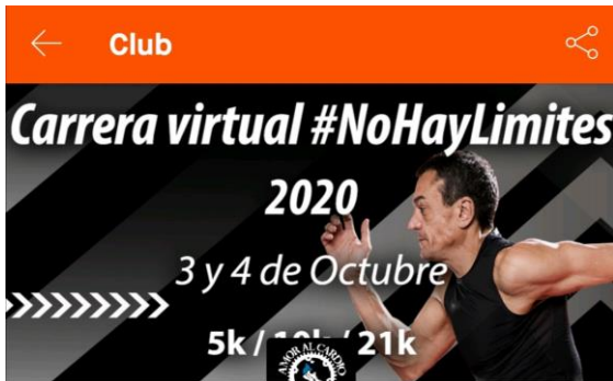
Imagen del grupo en Strava: